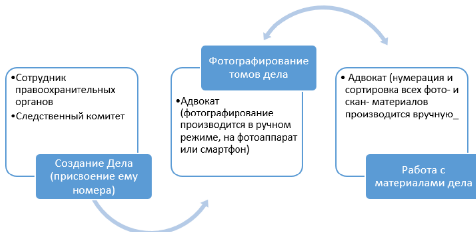
Рис. 1. Процесс взаимодействия с материалами дела

Общий процесс делопроизводства включает в себя следующих представителей: фигурант(ы) дела, адвокат(ы), сотрудник(и) правоохранительных органов, представители судейской коллегии. При открытии дела ему присваивается номер, и все документы, относящиеся к данному делу, нумеруются и объединяются в тома. Так как тома хранятся у сотрудников правоохранительных органов и не могут быть вынесены за пределы участка, адвокатам предоставляется право фотографирования всех документов для возможности дальнейшей работы с фото- и скан-копиями. В общем виде процесс описан ниже (см. рис. 1).